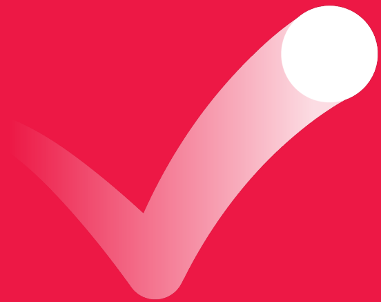
Primært logomark (hvid) Bruges alle steder