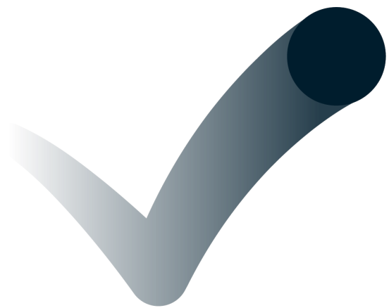
Alternativt logomark (mørk) Kan f.eks. bruges på lyseblå baggrund