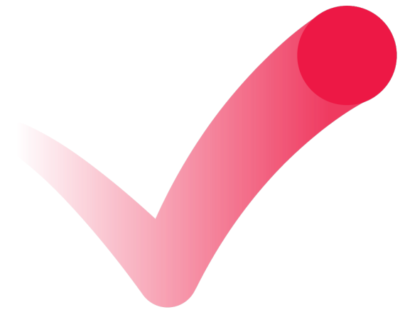
Negativt logomark (rød) Bruges i tilfælde af behov for hvid baggrund